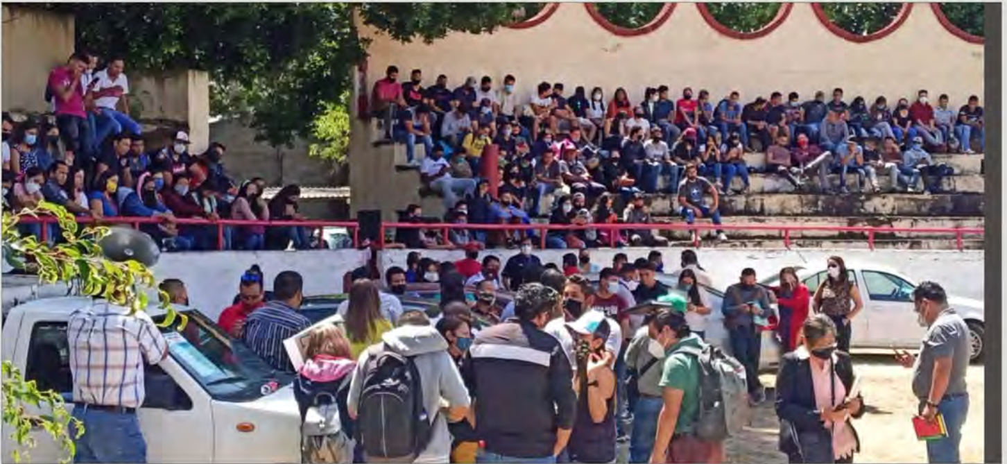
Morelia, Michoacán, a 14 de octubre del 2020.